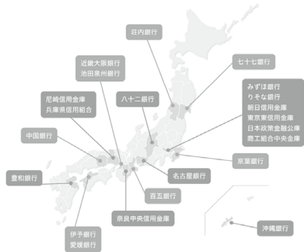
【図表2】2014年度に知財ビジネス評価書に取り組んだ金融機関